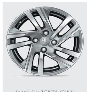
Jante Alu 16" TAKSIM