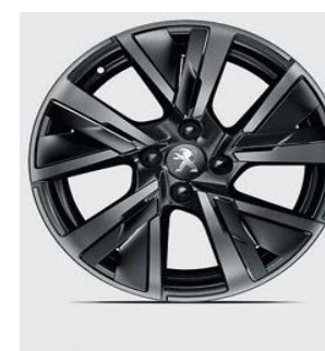
Jante Alu 17" BRONX