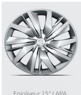
Enjoliveur 15" LAPA