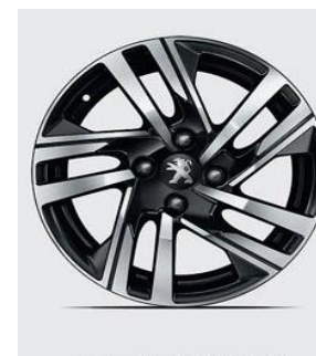
Jante Alu 16" SOHO