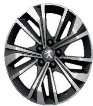
17" MERION Diamantee