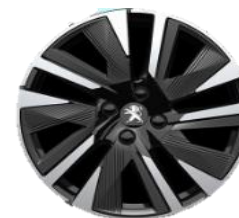
Jante aliaj diamantate cu insertii gri 18"