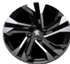
Jante aliaj diamantate 17"