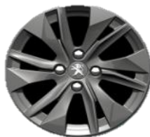
Jante aliaj 16"